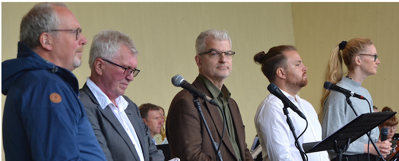
Röster från olika kyrkor på scenen